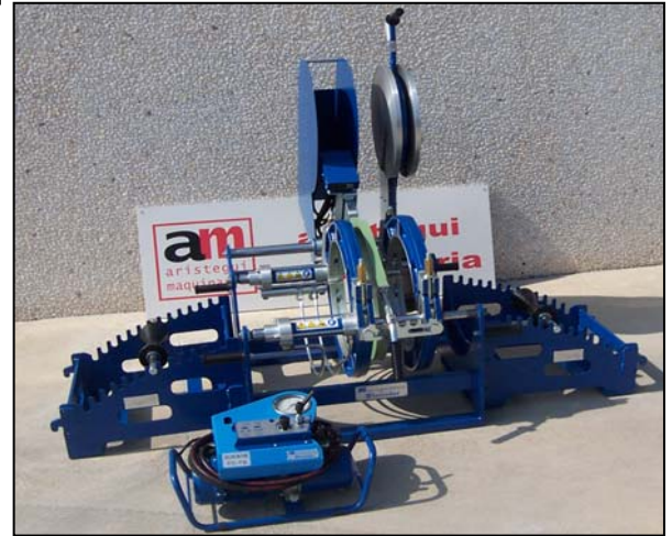
Soportes laterales desmontables